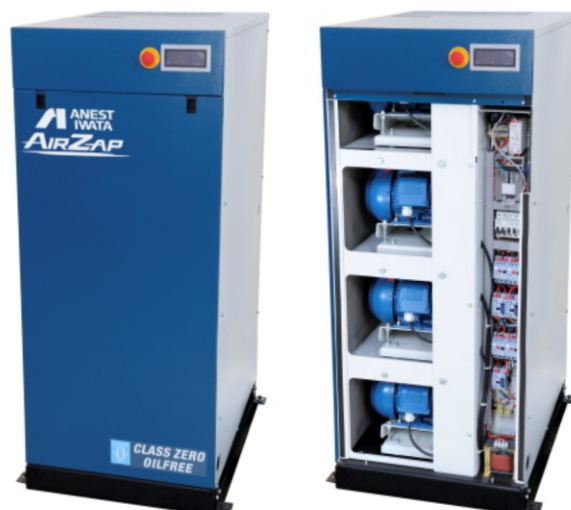
SLE-10 SLE-15 SLE-20