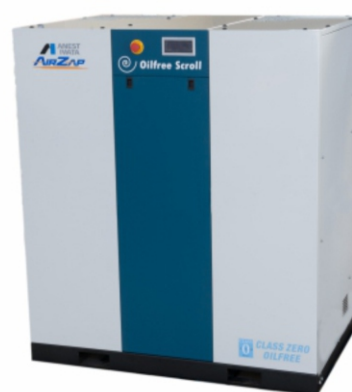
SLE-30 SLE-40 SLE-50 SLE-60